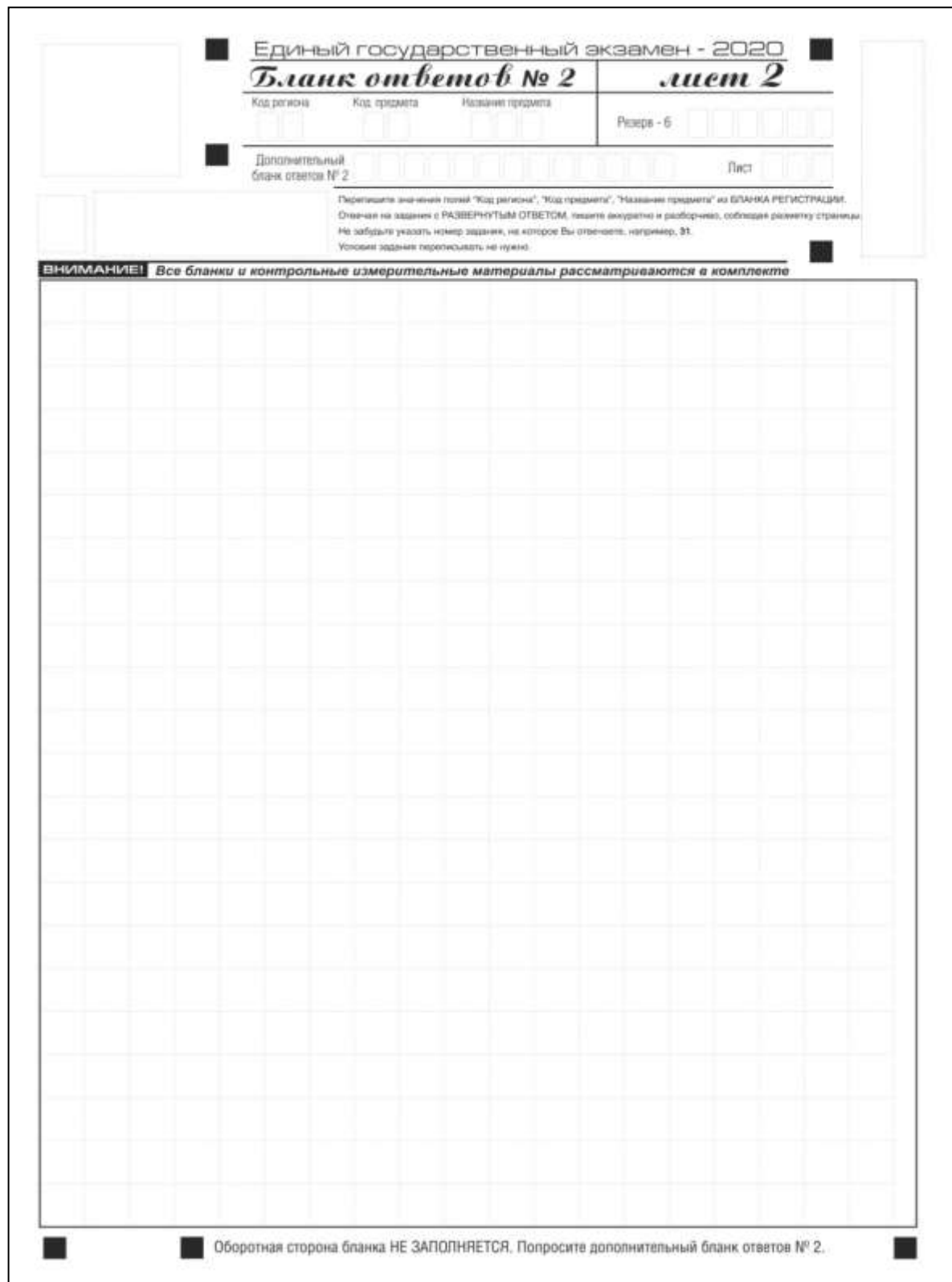
Рис.13. Бланк ответов № 2 по китайскому языку (лист 2)

Односторонний бланк ответов № 2 (лист 1 и лист 2) предназначен для записи ответов на задания с развернутым ответом по китайскому языку (строго в соответствии с требованиями инструкции к КИМ и к отдельным заданиям КИМ). Каждый